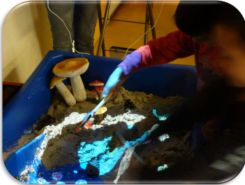
Afbeelding 1: Kleuters van Basisschool de Roos testen Animaatje