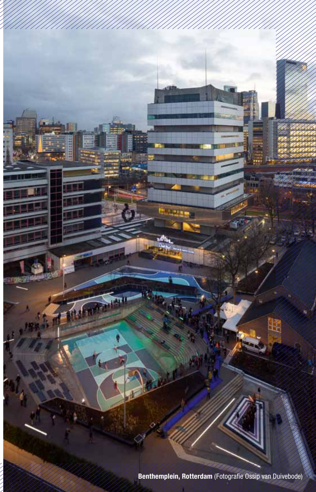
Benthemplein, Rotterdam