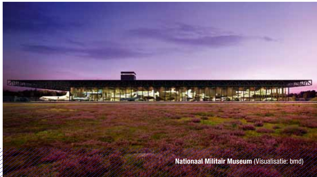
Nationaal Militair Museum