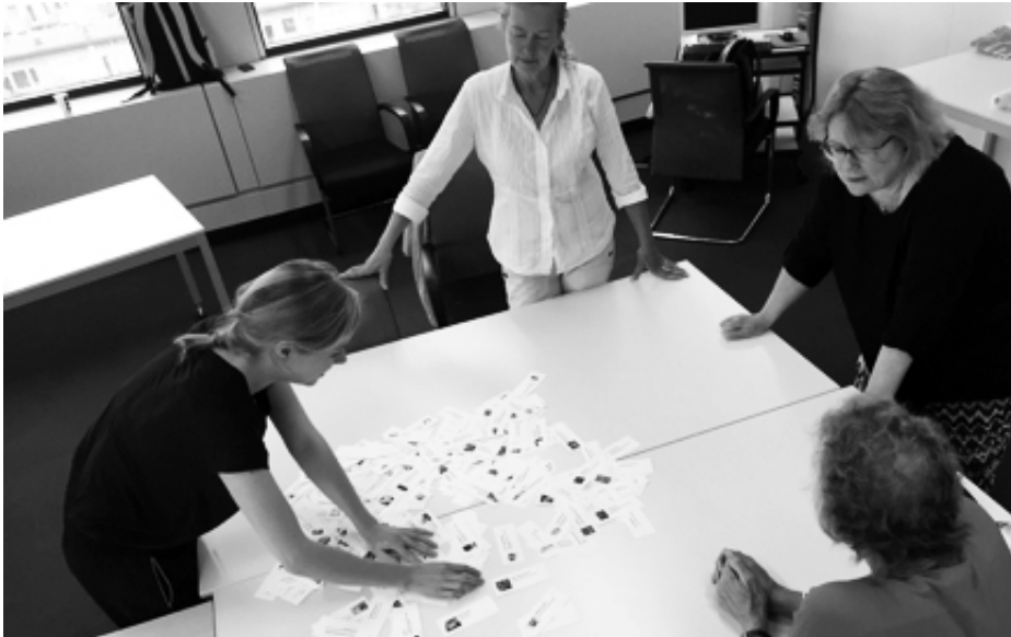
Afbeelding 2. Het gezamenlijk ordenen van de aanbod-kaartjes

wonen met dementie. Goede informatie over toepassing van producten is nodig en gebleken is dat deze niet altijd makkelijk te vinden is. Een product als een zwaartedeken bijvoorbeeld kan bescherming en geborgenheid bieden en daardoor mogelijk onrust tegengaan. Dit is zonder toelichting niet op voorhand duidelijk.