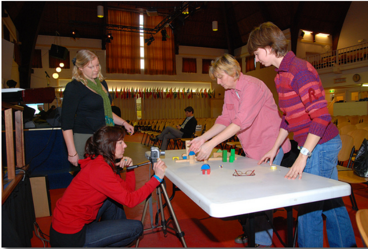
Workshop Animatiefilms maken