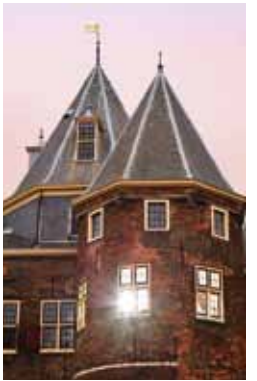
My lab is my castle Im Waag, dem Gildehaus auf dem Amsterdamer Nieuwmarkt, machte Nicolaes Tulp einst seine Leichenexperimente. Heute sitzt hier unter anderem das Genlabor – in dem keinem Bakterium ein echtes Leid geschieht

„Das Potenzial dieser Technologie können wir noch gar nicht absehen“, fügt er hinzu. „Dass sie für gute Dinge genutzt wird, dazu könnten wir Biohacker etwas beitragen.“ Ein Spiel, das gleichzeitig ernst ist. Auch das gibt es schon. ■